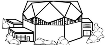
St. Franz Sales