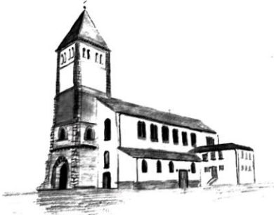
St. Mariä Himmelfahrt